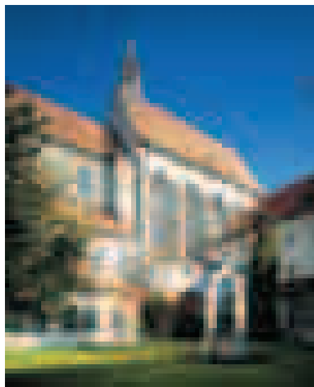
Die ehemalige Minoritenkirche St. Salvator

Eine Anmeldung ist unbedingt erforderlich, die Teilnahme ist kostenfrei. Please register on the registration form. The attendance is free of charge.